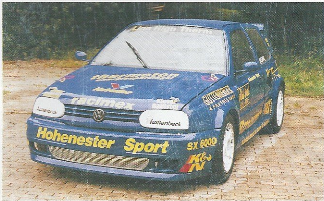
Der Hammer: VW Golf mit 500 PS