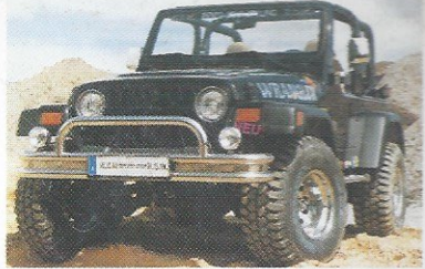
Jeep für echte Cowboys