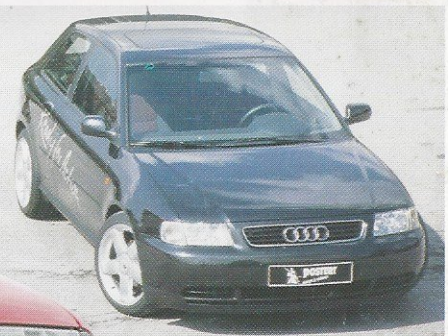
Aktuell: Audi A3