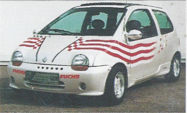
Twingo für guten Zweck

OPEL • VW • AUDI BMW • ALFA • FIAT HONDA • MERCEDES