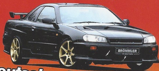
Deutscher R34 Skyline!