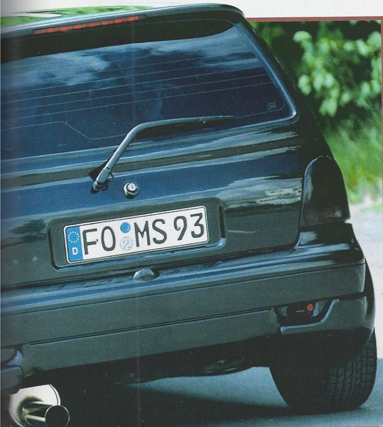
Schwarze Stahlfelgen von Mattig, getönte Scheiben und Gruppe N Auspuff von SK-Tuning sehen nicht nur gut aus

Für alle Liebhaber luftgekühlter Volkswagenen: