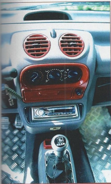
Teilweise sorgt roter Lack im Cockpit für ein farbiges Umfeld

war, ließ sich noch einiges verbessern. Den Sound verschärfte Markus mit einer unüberhörbaren Gruppe N Edelstahlanlage. In die Frontschürze integrierte er Nebelscheinwerfer. Außen wie innen wurde die metallischschwarze Lackierung mit roter Farbe aufgelockert. Neben den lackierten Blenden erhielten auch die Schalen der Scheelmann Sitze ein knackiges Rot. Die Fußmatten bestehen aus stabilem Alu und wurden von einem