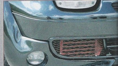
Nachrüstaktion: die Nebelscheinwerfer und das Schutzgitter