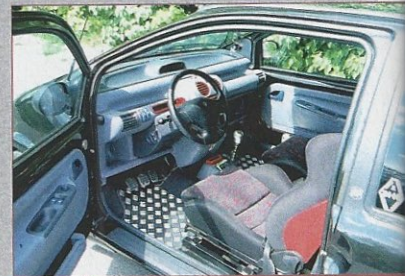
Sportlich dank Sportsitzen mit Schrotgurten und Riffelblechfußmatten