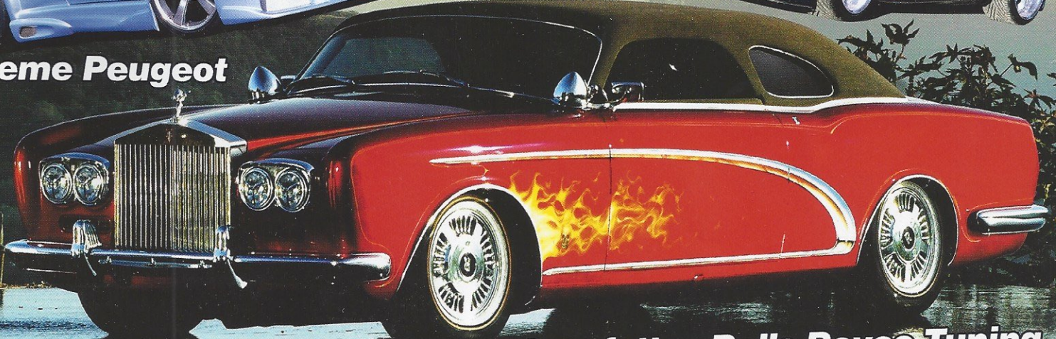
Show Bizz - fettes Rolls Royce Tuning