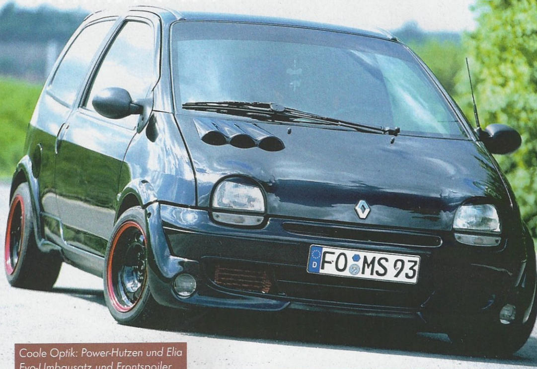
Cooler Optik: Power-Hutzen und Elia Evo-Umbausatz und Frontspoiler