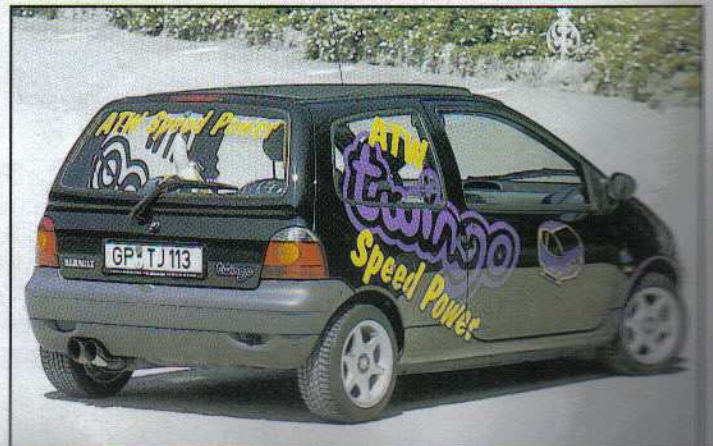
... ist schwarz wie der Teufel ...