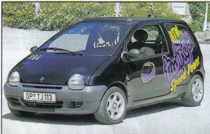
Die zahmere Version ...