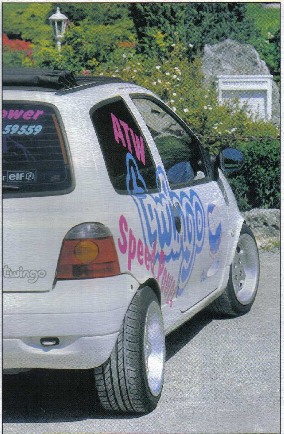
Die Seitenwände mußten sich „strecken“, um die 195er Reifen beherbergen zu können.

anten bestückt werden kann. Wer diesen Twingo einmal gefahren hat, will nichts anderes mehr. Unseren Testfahrer mußten wir an den Haaren aus dem Auto ziehen, wobei er sich mit Händen und Füßen wehrte.