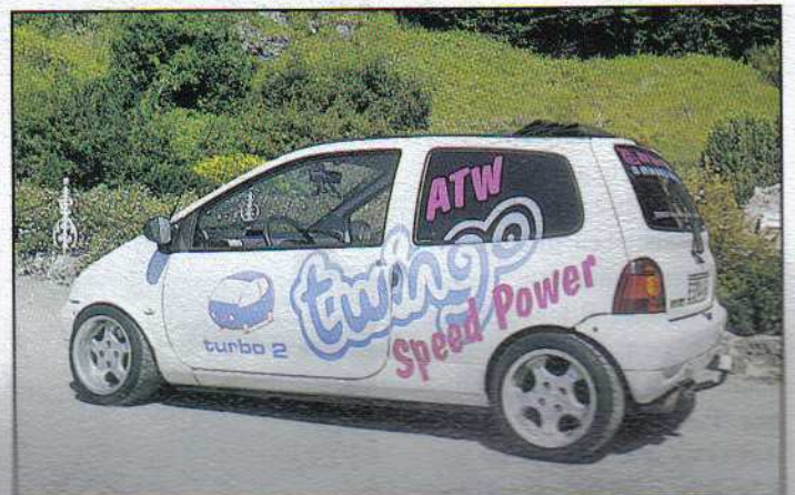
... und die ideale Variante ...