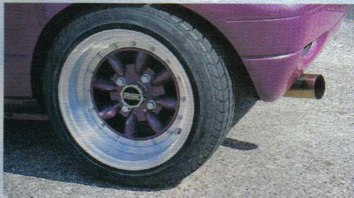
Klassiker: Smoor in 8x13 Zoll ET 15 mit 15er Distanzen

Auf den Bildern nicht zu sehen, aber verfügbar sind Heckleuchten, Blinker an der Front und Seitenblinker in verschiedenen Farben. D. E.