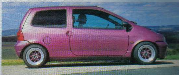
Verstellbar: Mit dem H&R Fahrwerk ist an beiden Achsen ein Verstellbereich von 50-80 Millimetern möglich

Purple-Green Percolour überzieht das Blech dieses Twingo. Tuner XTC kombiniert ihn mit zahlreichen Tuning-Gourmet-Stücken.