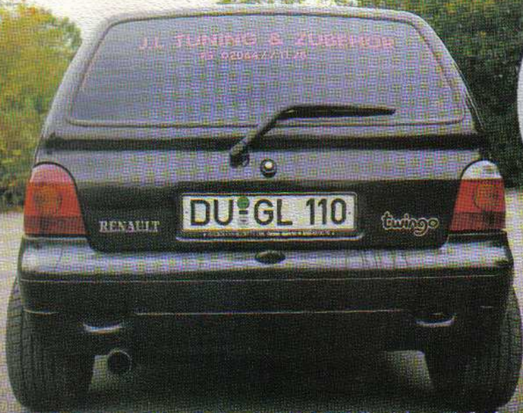
Volle Breite: 195er Reifen auf 8x14 Zoll wirken einfach