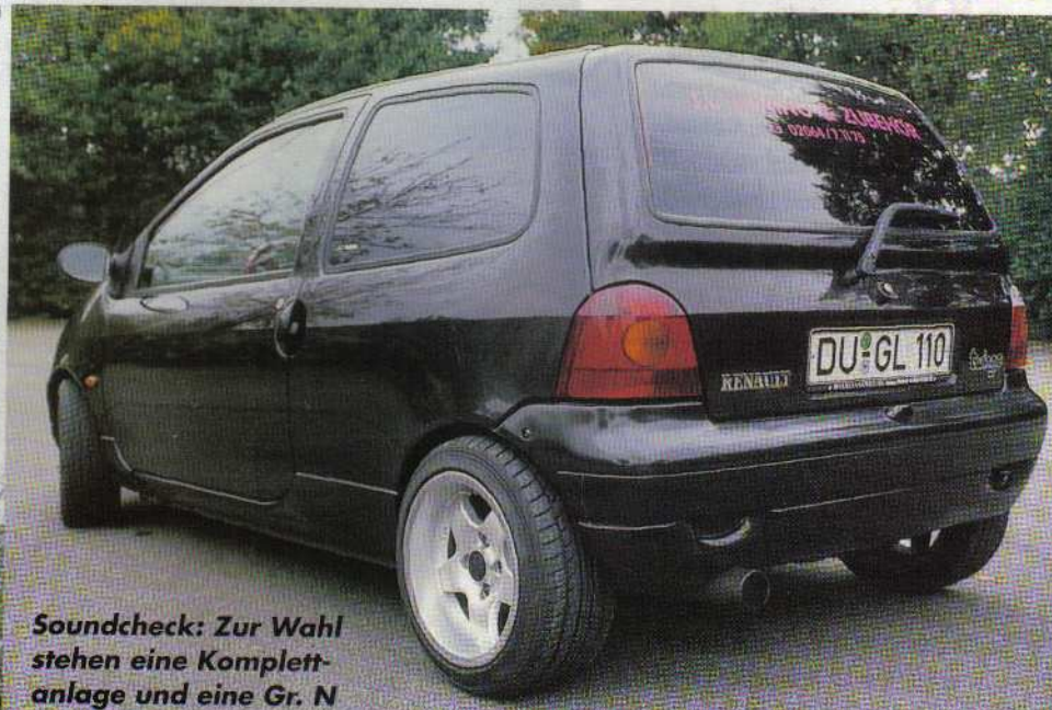
Soundcheck: Zur Wahl stehen eine Komplettanlage und eine Gr. N