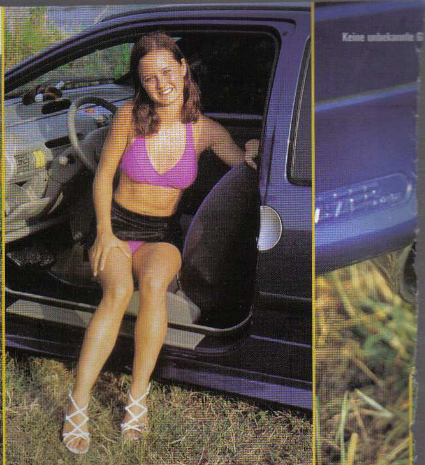
Keine unbekannte E