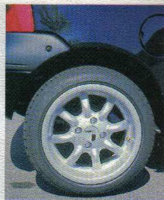
Race-Flair: die 8x14-Zoll Eurotecs mit 195/45