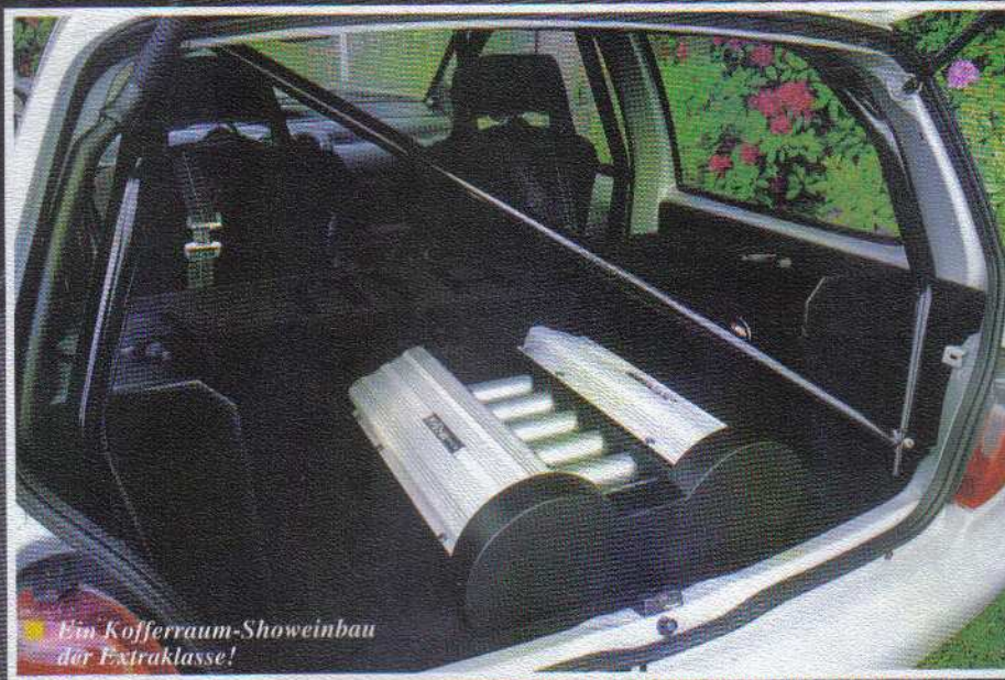
■ Ein Kofferraum-Showeinbau der Extraklasse!

Wenn andere von den tollsten Nobelkarossen und superschnellen