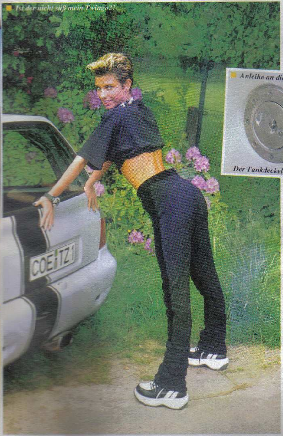
■ Ist der nicht süß mein Twingo??