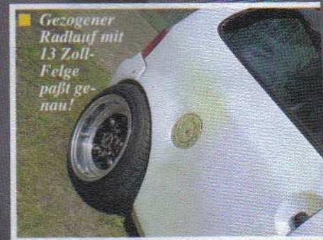
■ Gezogener Radlauf mit 13 Zoll-Felge paßt genau!

Aber der Twingo hat noch mehr verborgene Werte. Die aber bleiben nur