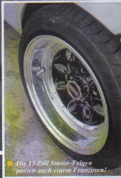
■ Die 13 Zoll Smoor-Felgen passen auch einem Franzosen!

Ganz unschuldig ist der Twingo deshalb noch lange nicht. Der böse Blick, ein DTM-Tankdeckel und die weißen